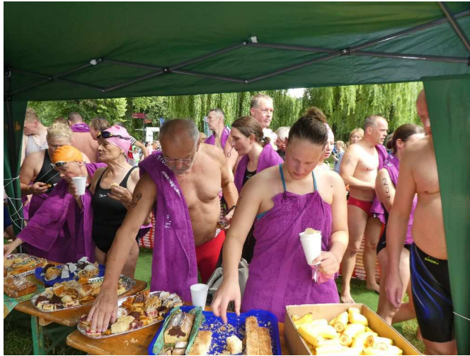
Bei der Verpflegung