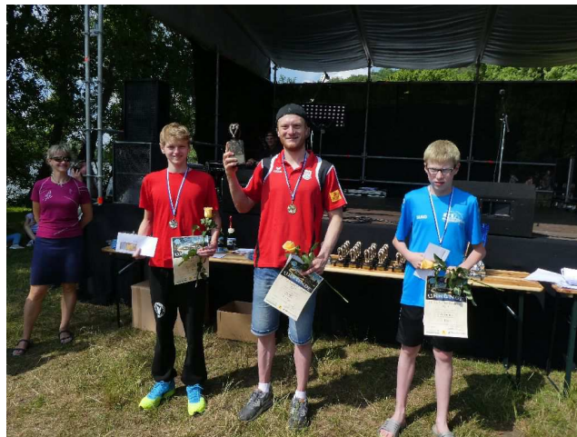
Gesamtsieger der Männer