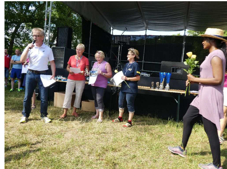
Die Siegerinnen AK 70