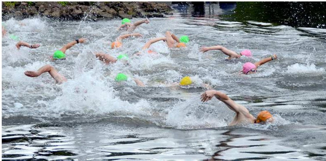
112 Frauen und 128 Männer haben sich in die Saalefluten gestürzt.