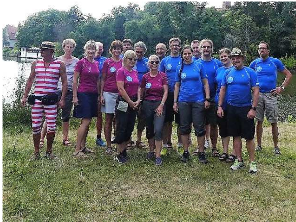
Die Macher des Saaleschwimmens