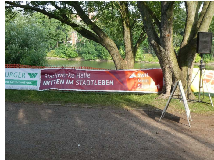
Banner der Sponsoren