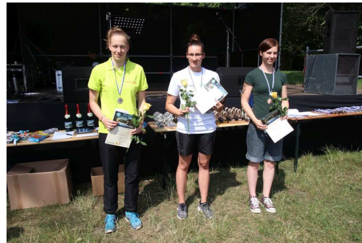
Die Gesamtsiegerinnen der Frauen