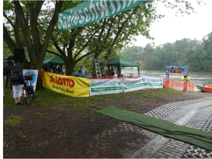
Banner der Sponsoren