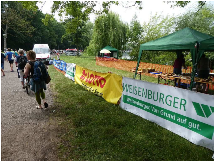
Banner der Sponsoren