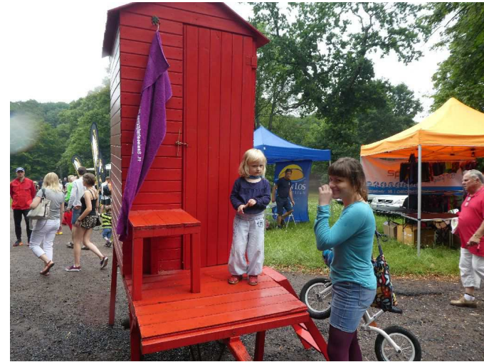
Teilnehmer der Zukunft auf der Badekarre