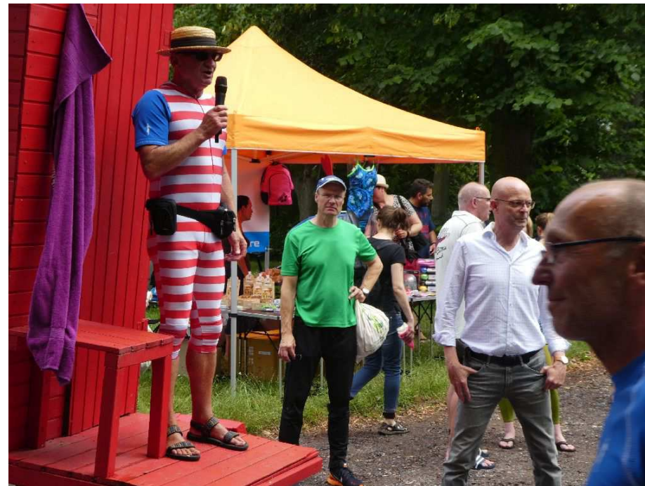
Eröffnung mit dem OB