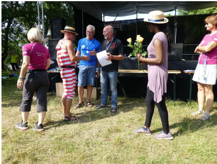
Die Sieger der AK 70