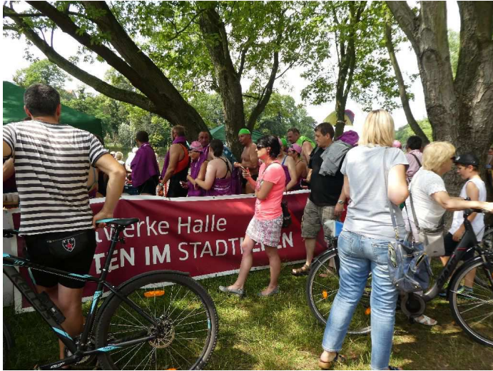
Banner der Sponsoren